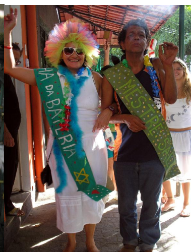
Rainha da bateria e mestre-sala