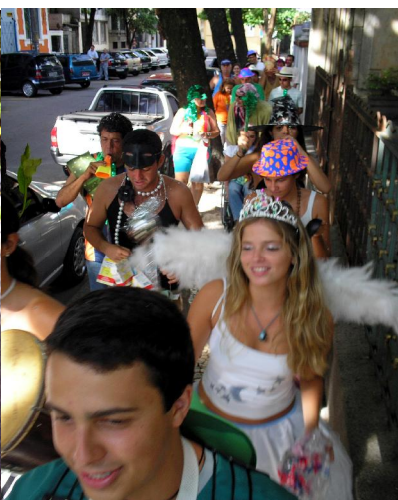
Nas redondezas do Casa Verde