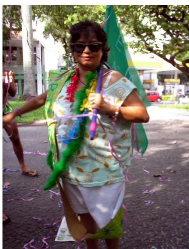
Samba no pé da porta-bandeira

Este ano a comemoração do Carnaval no Casa Verde foi inédita: fizemos uma marchinha sobre a casa, nos fantasiamos, tivemos porta-bandeira e mestre-sala, rainha da bateria e até comissão de frente! Saímos todos muito animados pelas redondezas da casa e no final invadimos o Supermercado Sendas e a Escola de Dança Angel Vianna, deixando todo mundo de boca aberta com a nossa animação! Todos se divertiram! Contamos com a participação de todos no ano que vem!