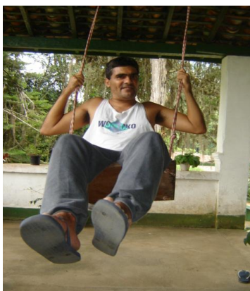
Casa da Fazenda

A casa onde ficamos era grande, tinha dois balanços onde todos gostavam de ficar, tinha também fogão à lenha e uma cozinheira que preparava as nossas refeições.