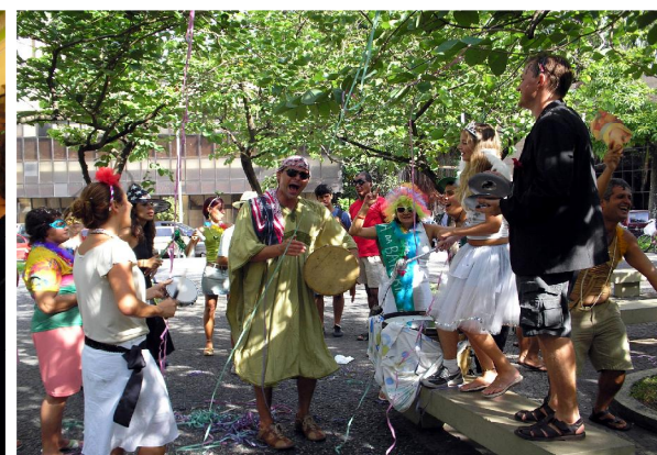
Diversão na praça