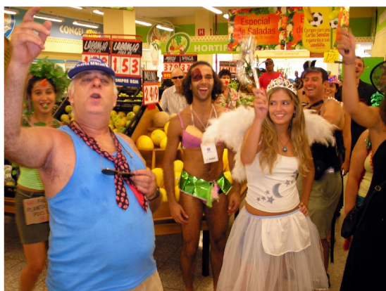
A invasão no Supermercado Sendas